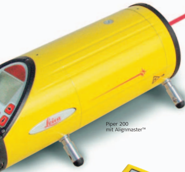
Piper 200 mit Alignmaster™